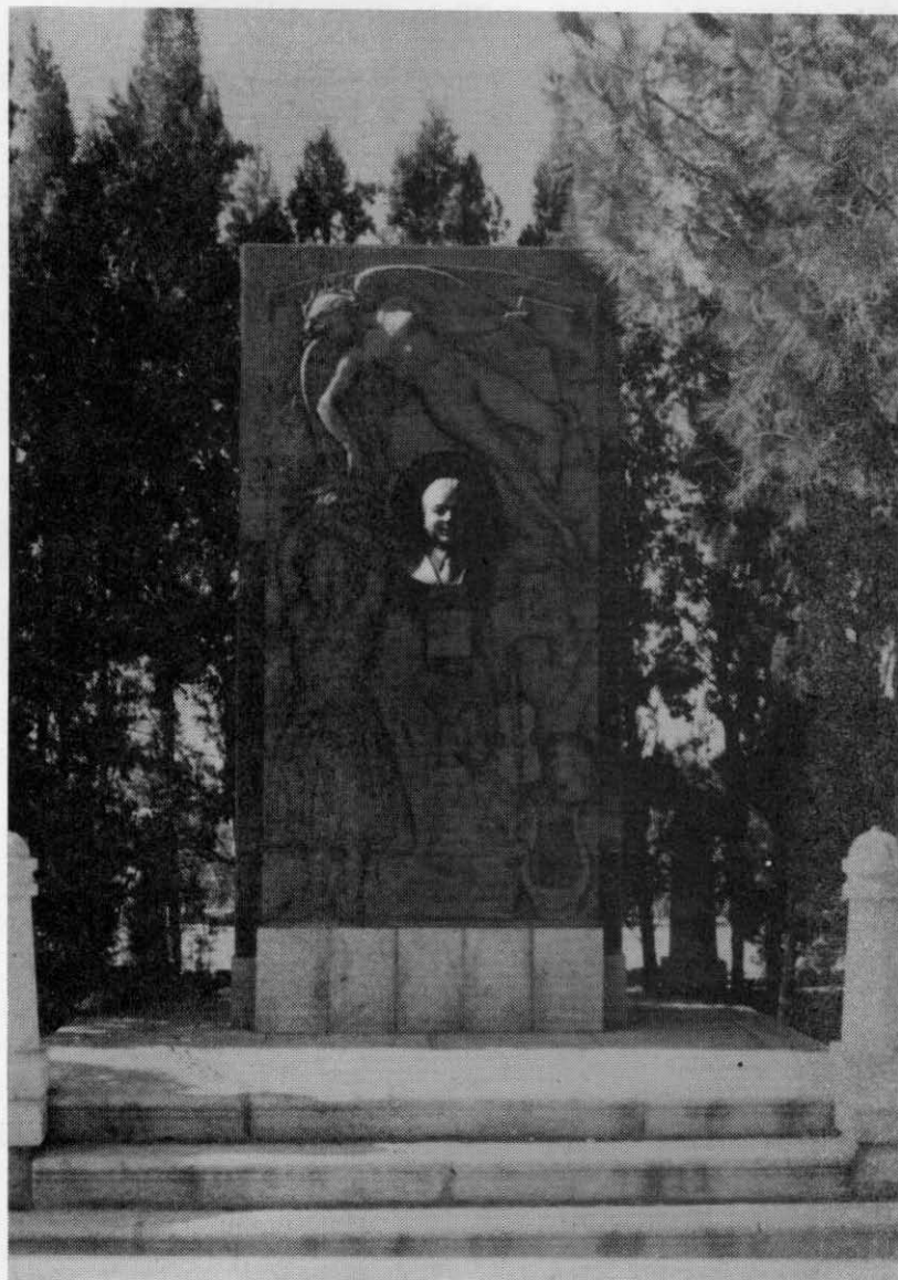
Monumento al maestro Guerrero en la Vega de Toledo, obra de Comendador.