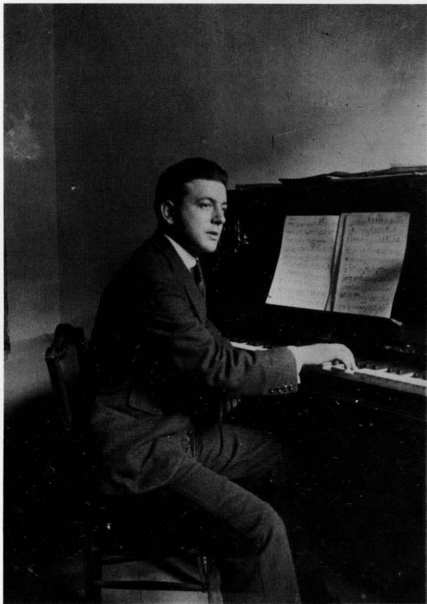
El maestro Guerrero en sus primeros años de éxito.