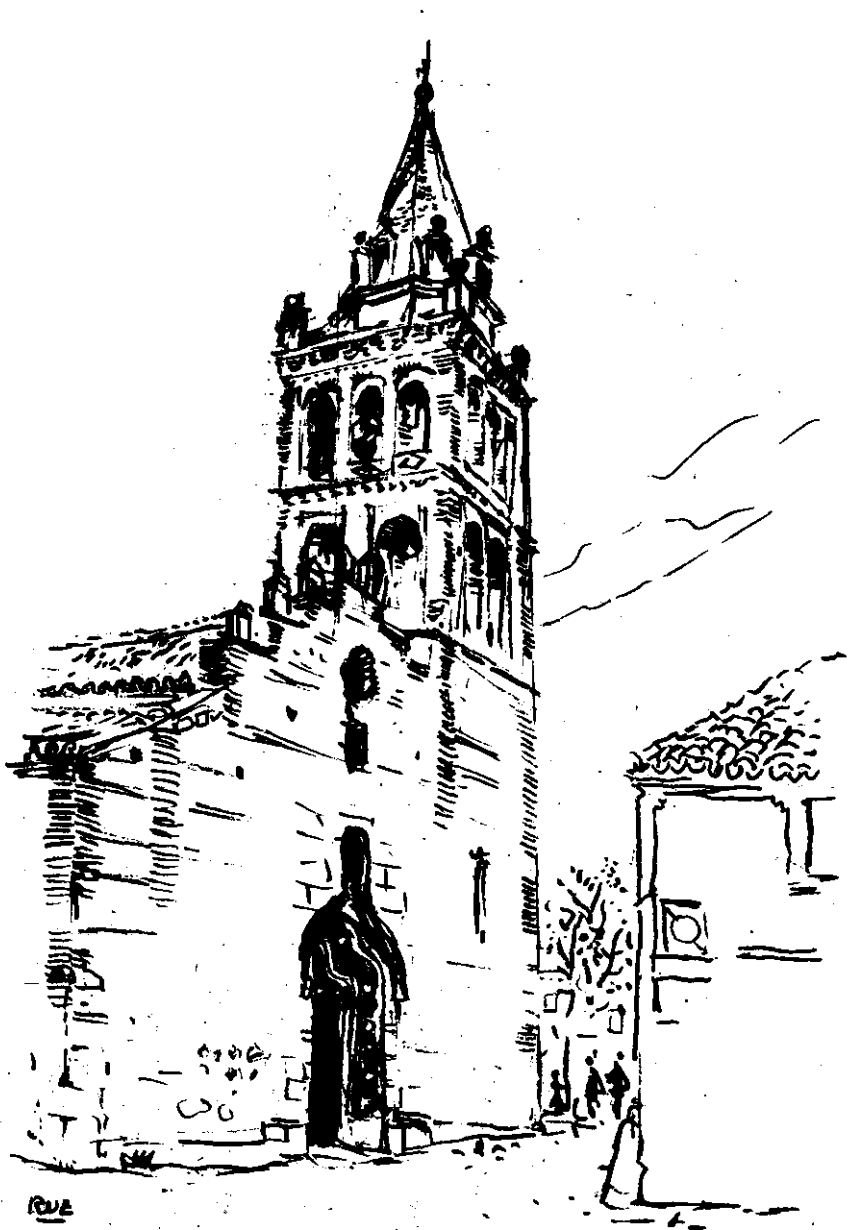
Iglesia Parroquial de Ajofrín, villa natal del compositor