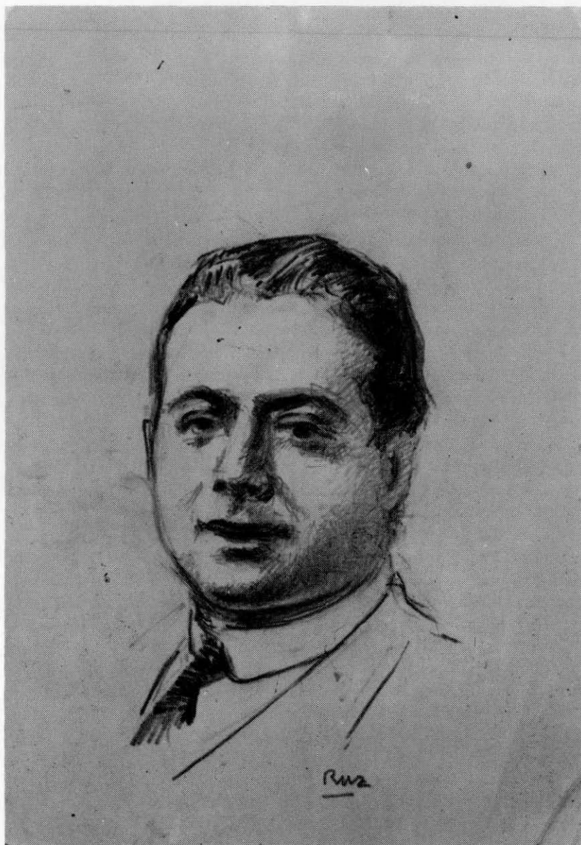
Jacinto Guerrero, dibujo de José Luis Ruz