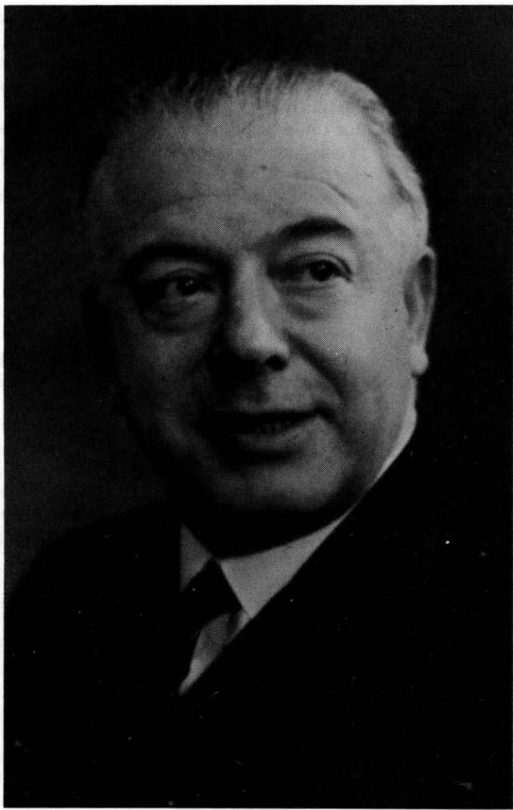
Don Jacinto Guerrero en su madurez.