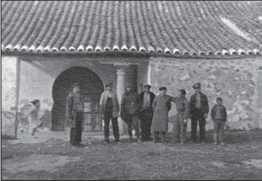
Casalgordo, miembros de la expedición junto al exterior de la iglesia parroquial, 5 de marzo de 1938.