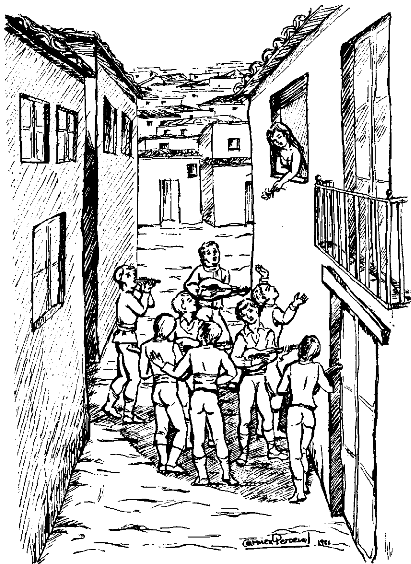
LA RONDA (Dib. de Carmen Perceval)