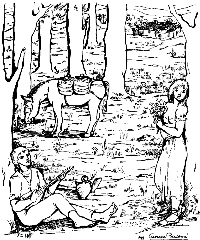
EL RABEL (Dib. de Carmen Perceval)