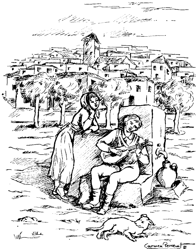
LA FUENTE (Dib. de Carmen Perceval)